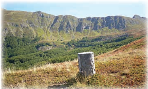
Foto 6: vetta del Libro Aperto scendendo verso Serra delle Motte dal sentiero 00

ma la mole del Cimone, mentre a Sud si può osservare il Libro Aperto, segnato dalle tracce degli antichi ghiacciai. Raggiunta la vetta del Lagoni, e lasciato alle spalle il tratto più faticoso ed impegnativo del tracciato, si prosegue lungo il crinale verso Sud guadagnando il Libro Aperto attraverso il sentiero CAI 447; questo tratto è molto panoramico e permette di riposarsi dalle fatiche dell'ascesa ripagandole con i panorami offerti. La salita alla vetta del Libro Aperto (terzo punto di osservazione consigliato) può essere effettuata direttamente seguendo il sentiero 447, superando un piccolo scalino roccioso attrezzato con cavo, oppure scendendo nella sella fra le due cime e risalendo dal meno impegnativo versante meridionale. Il panorama dal Libro Aperto (1.937 mt) è unico: lo sguardo spazia a 360° dal Cimone al Corno alle Scale, lungo la direttrice Nord-Sud e dal Giovo all'alta valle del Panaro seguendo la direttrice Ovest-Est e comprendendo numerosi e diversi tipi di ambienti naturali. Dalla vetta