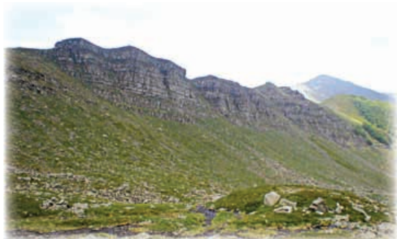
Foto 5: alta valle delle Fontanacce. Le praterie di alta quota oltre il limite degli alberi sono il terreno di caccia ideale per l'aquila reale (Davide Pagliai)

L'area di nidificazione risulta intensamente frequentata durante tutto il periodo di cova, durante i primi voli del giovane successivamente all'involo e nelle settimane immediatamente precedenti la deposizione per la preparazione del nido ed i voli di corteggiamento.