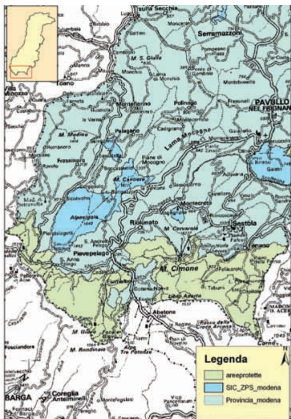
Fig. 1: area di studio

L'attività di monitoraggio è stata condotta dal personale del Servizio vigilanza del Parco, da personale volontario e da un tecnico che ha provveduto anche alla formazione degli operatori, al coordinamento dell'attività ed all'archiviazione dei dati all'interno di un data base informatizzato. Il fine delle attività di monitoraggio svolte dall'Osservatorio naturalistico del Parco del Frignano è principalmente quello di ottenere una base informativa solida che possa fornire alle amministrazioni interessate alla pianificazione territoriale gli strumenti utili per poter far coesistere il necessario sviluppo di attività umane con le altrettanto indifferibili urgenze di conservazione della biodiversità.